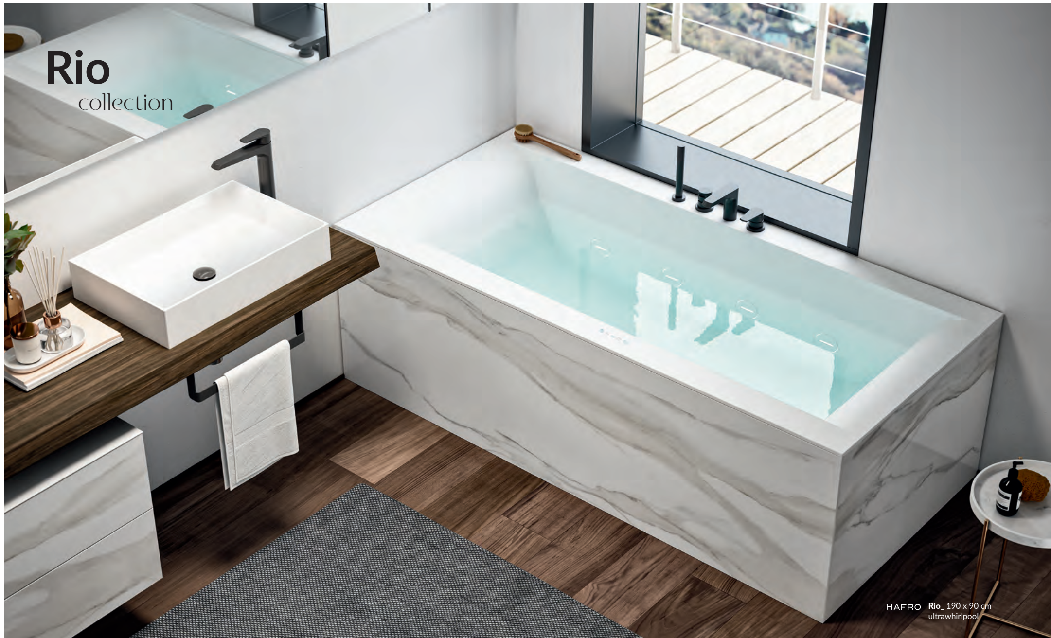
HAFRO Rio_ 190 x 90 cm ultrawhirpool