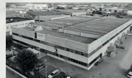
Hafro | Sauna Vita