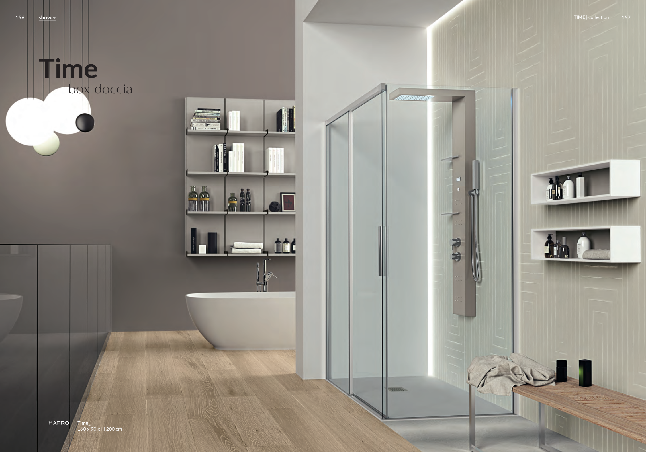
HAFRO Time 160 x 90 x H 200 cm