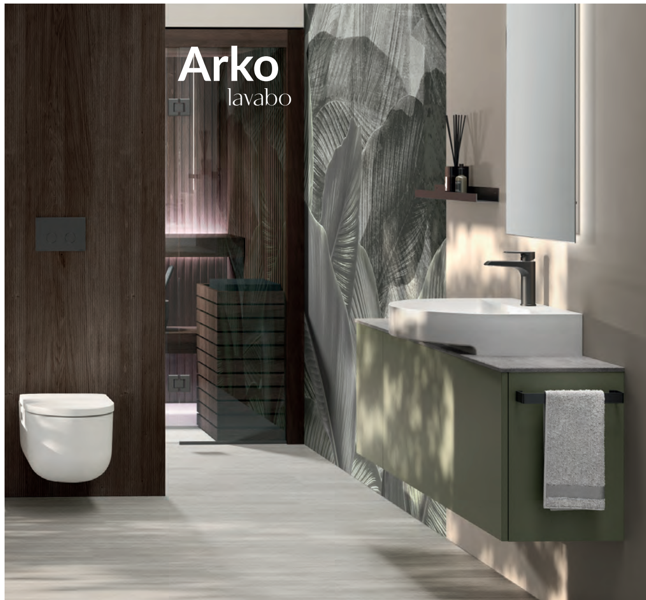
HAFRO Lavabo Arko_ colore bianco opaco Washbasin, matt white colour - Lavabo, couleur blanc mat