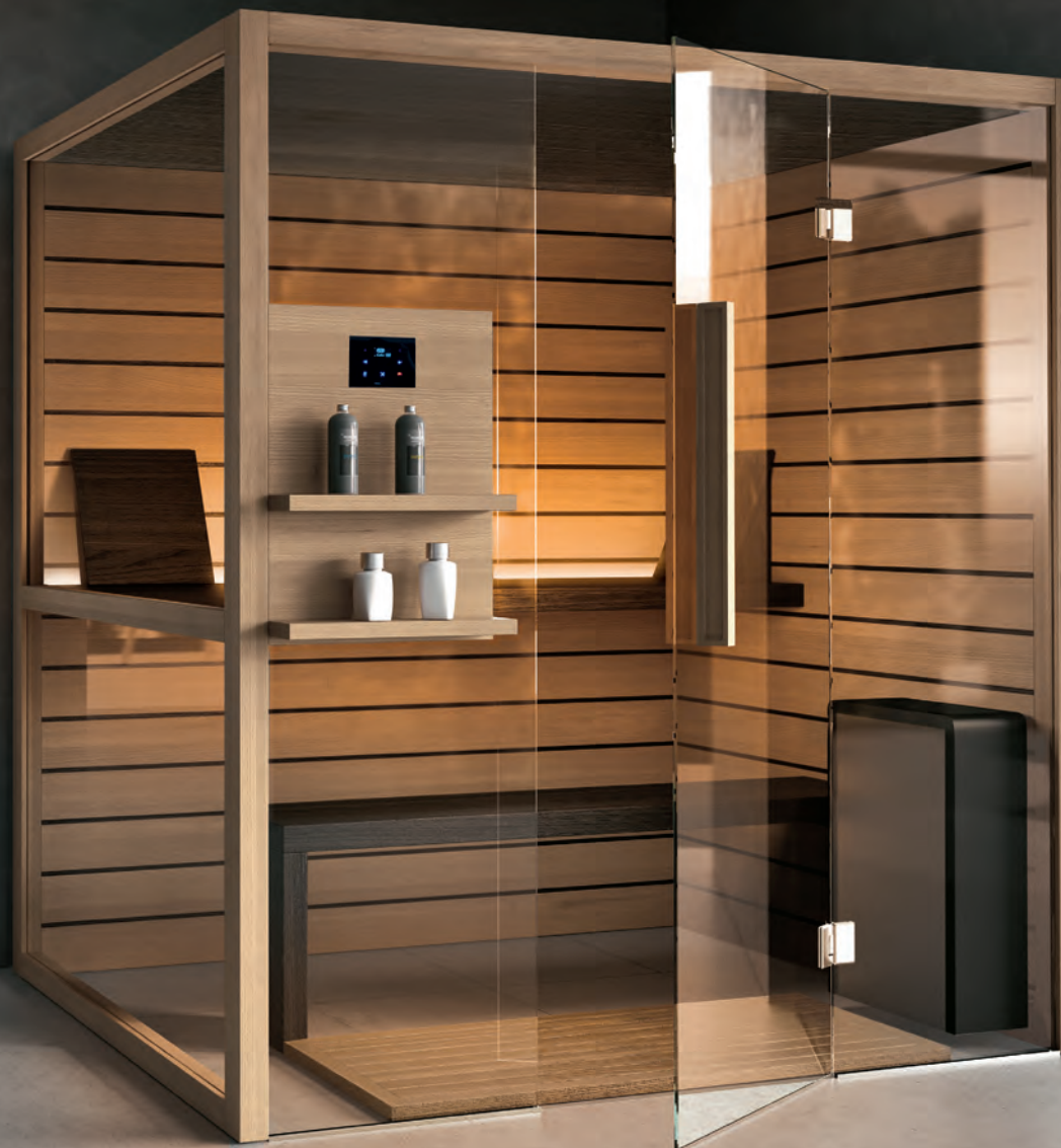
GEROMIN Kalika L 180 x P 180 x H 215 cm