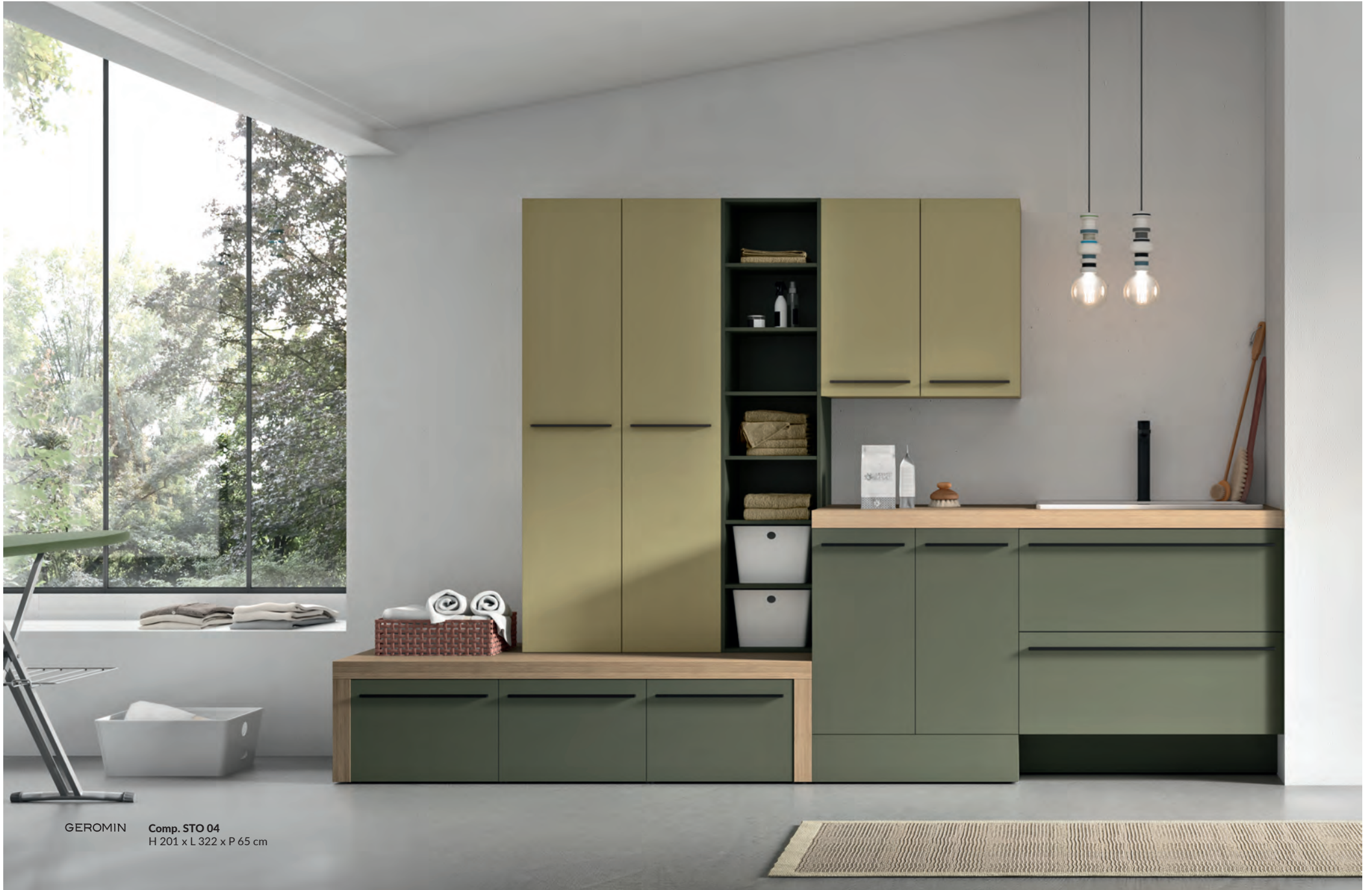
GEROMIN Comp. STO 04 H 201 x L 322 x P 65 cm