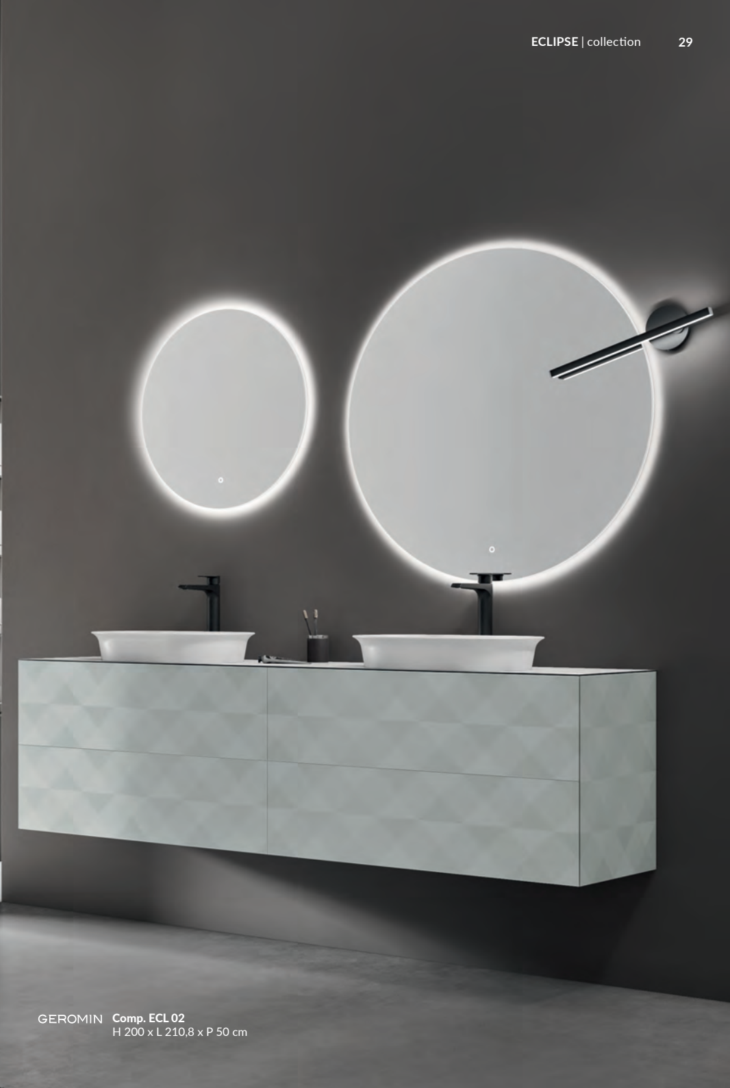
GEROMIN Comp. ECL 02 H 200 x L 210,8 x P 50 cm