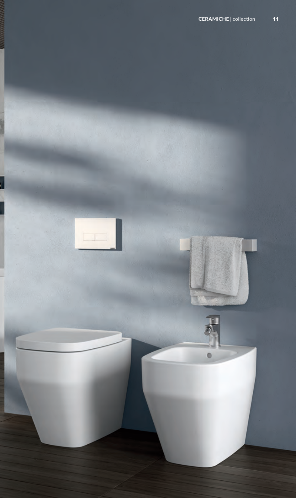
HAFRO Fio. Vaso e bidet a terra e vasca freestanding bianco opaco Matt white Ground-installed WC and bidet and freestanding bathtub WC et bidet au sol et baignoire autoportante blanc mat