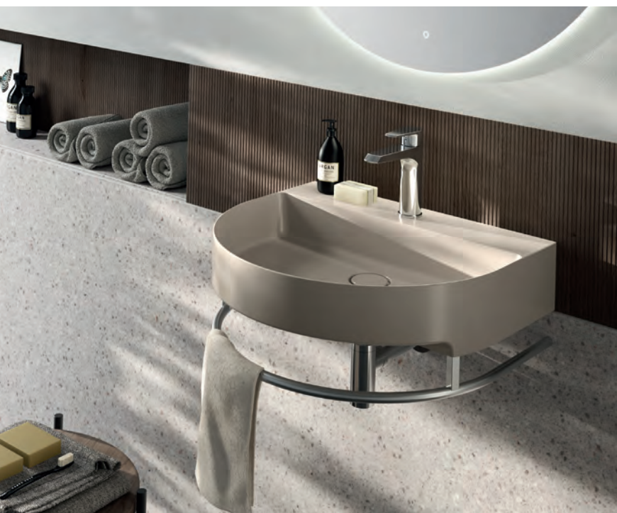
HAFRO Lavabo Arko_ colore sabbia opaco Washbasin, matt sand colour - Lavabo, couleur sable mat

Lavabo de comptoir qui décrit un arc parfait. Ses lignes classiques ont été revisitées pour s'adapter à des contextes plus moderne.