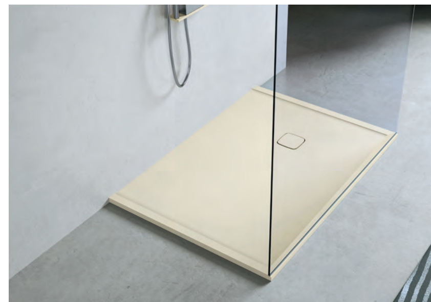
HAFRO Tecnotek FLAT con bordo_appoggio pavimento_ crema 120 x 90 cm With edge_Floor installation_Cream - Avec bord_Installation au sol_Crème