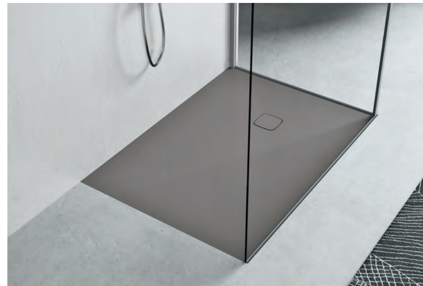
HAFRO Tecnotek FLAT_filo pavimento_ grigio scuro 120 x 90 cm Flush to floor installation_Dark Grey - Installation ras du sol_Gris foncé