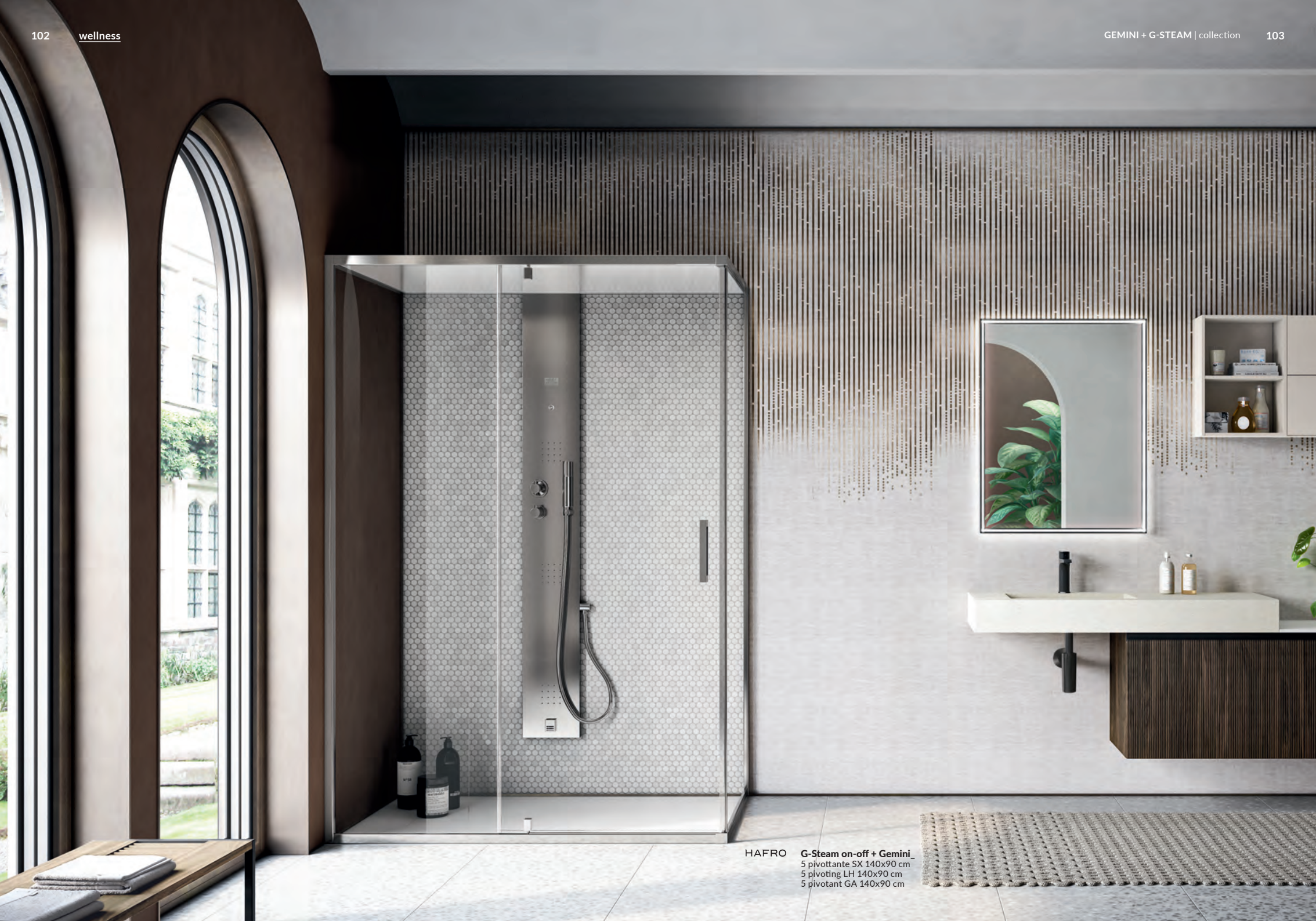
HAFRO G-Steam on-off + Gemini. 5 pivottante SX 140x90 cm 5 pivoting LH 140x90 cm 5 pivotant GA 140x90 cm