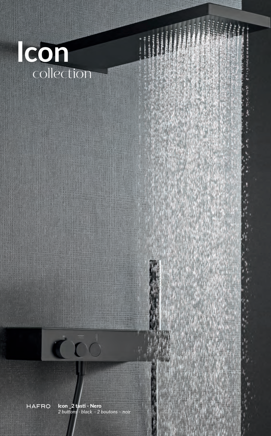
HAFRO Icon_2 tasti - Nero 2 buttons - black - 2 boutons - noir