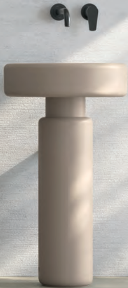
GEROMIN Comp. SUI 01 H 200 x L 245 x P 50 cm