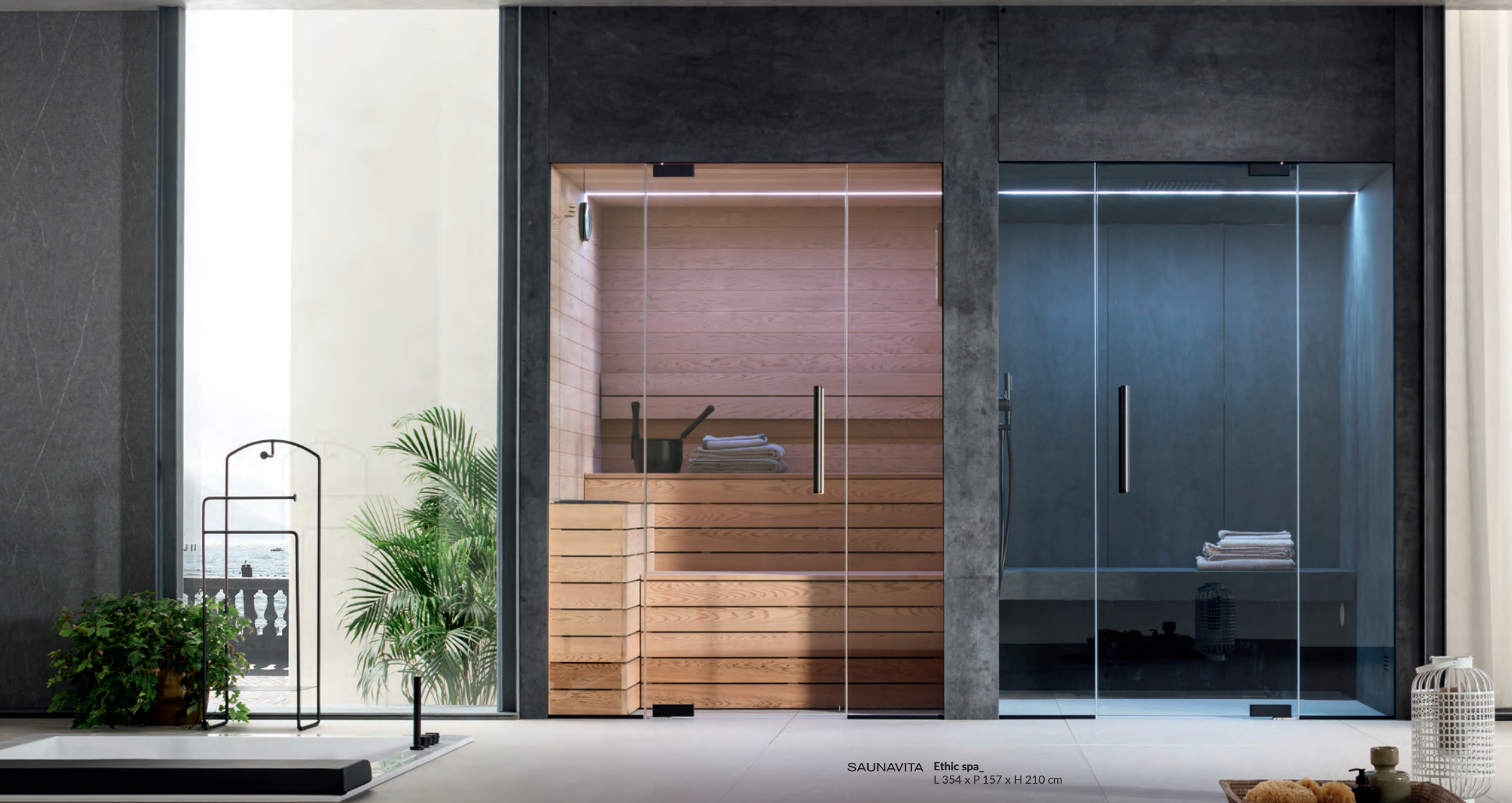
SAUNAVITA Ethic spa_ L 354 x P 157 x H 210 cm