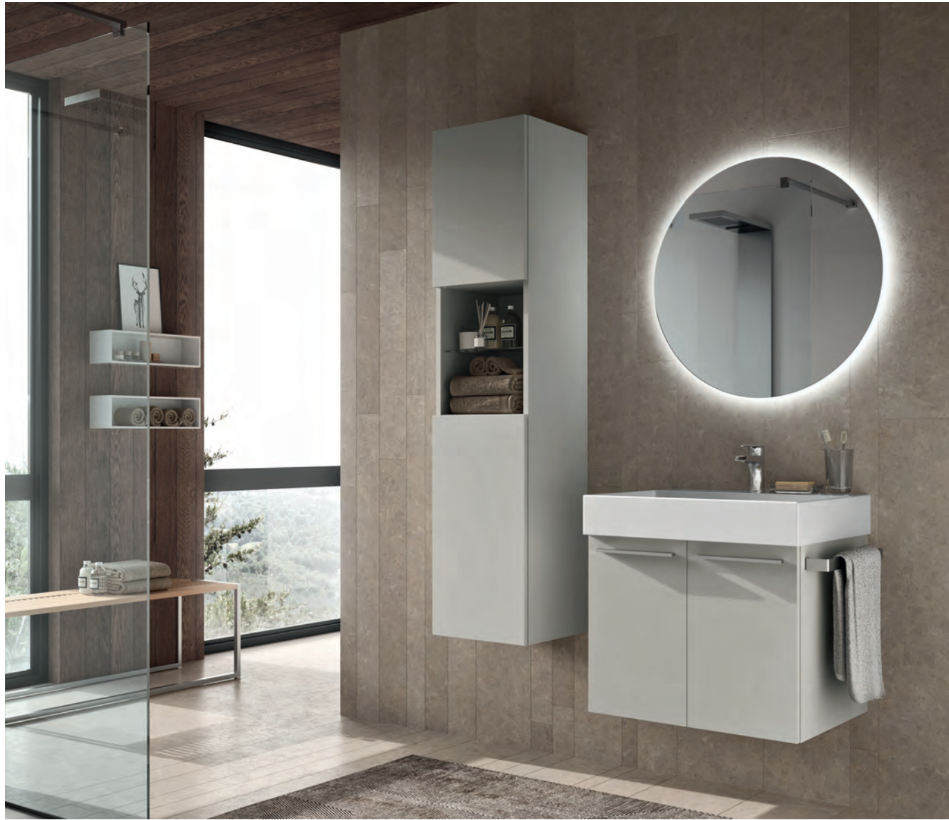
GEROMIN Comp. DOG 01 H 200 x L 96 x P 51 cm