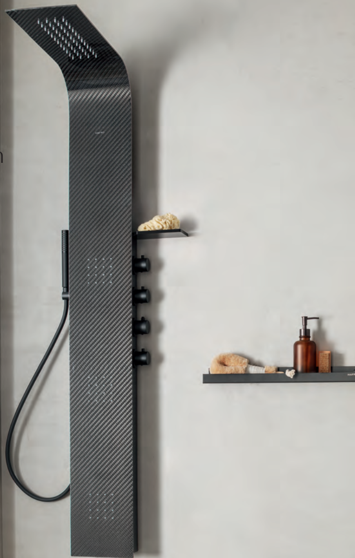
HAFRO Lama Carbonio