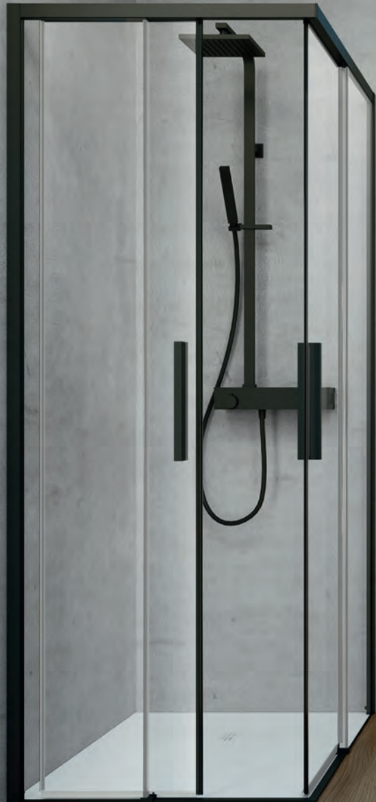
HAFRO Time_ 180 x 80 x H 200 cm