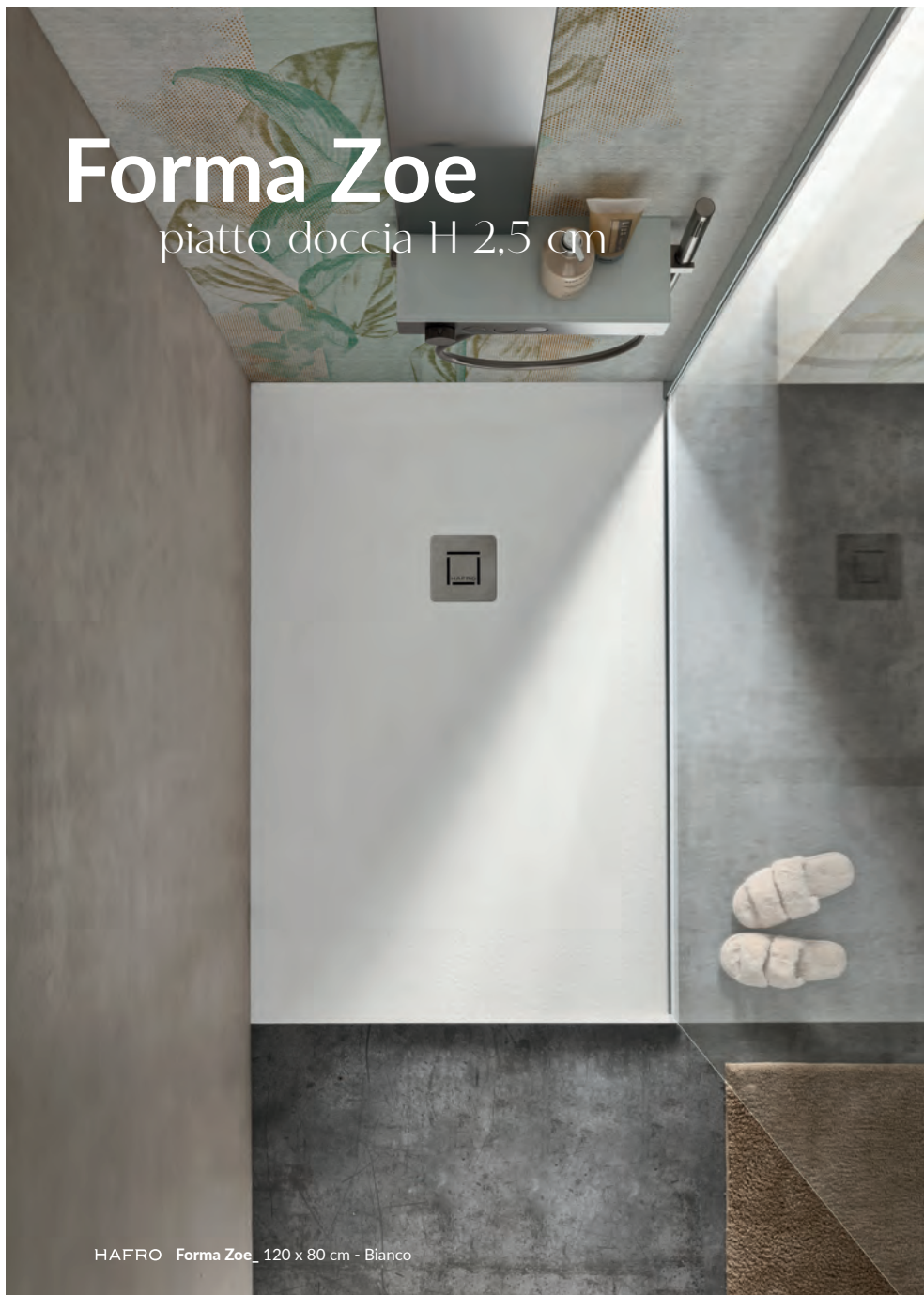
HAFRO Forma Zoe_120 x 80 cm - Bianco