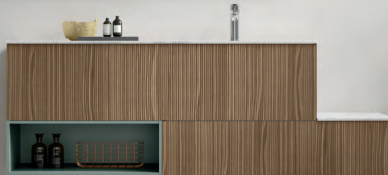
GEROMIN Comp. ELI 01 H 200 x L 280 x P 50 cm