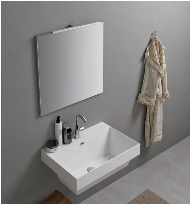
GEROMIN Consolle Doge in ceramica Ceramic Doge Consolle - Consolle Doge en céramique