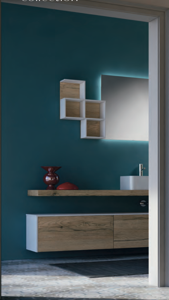
HAFRO Soul L 100 x P 90 cm