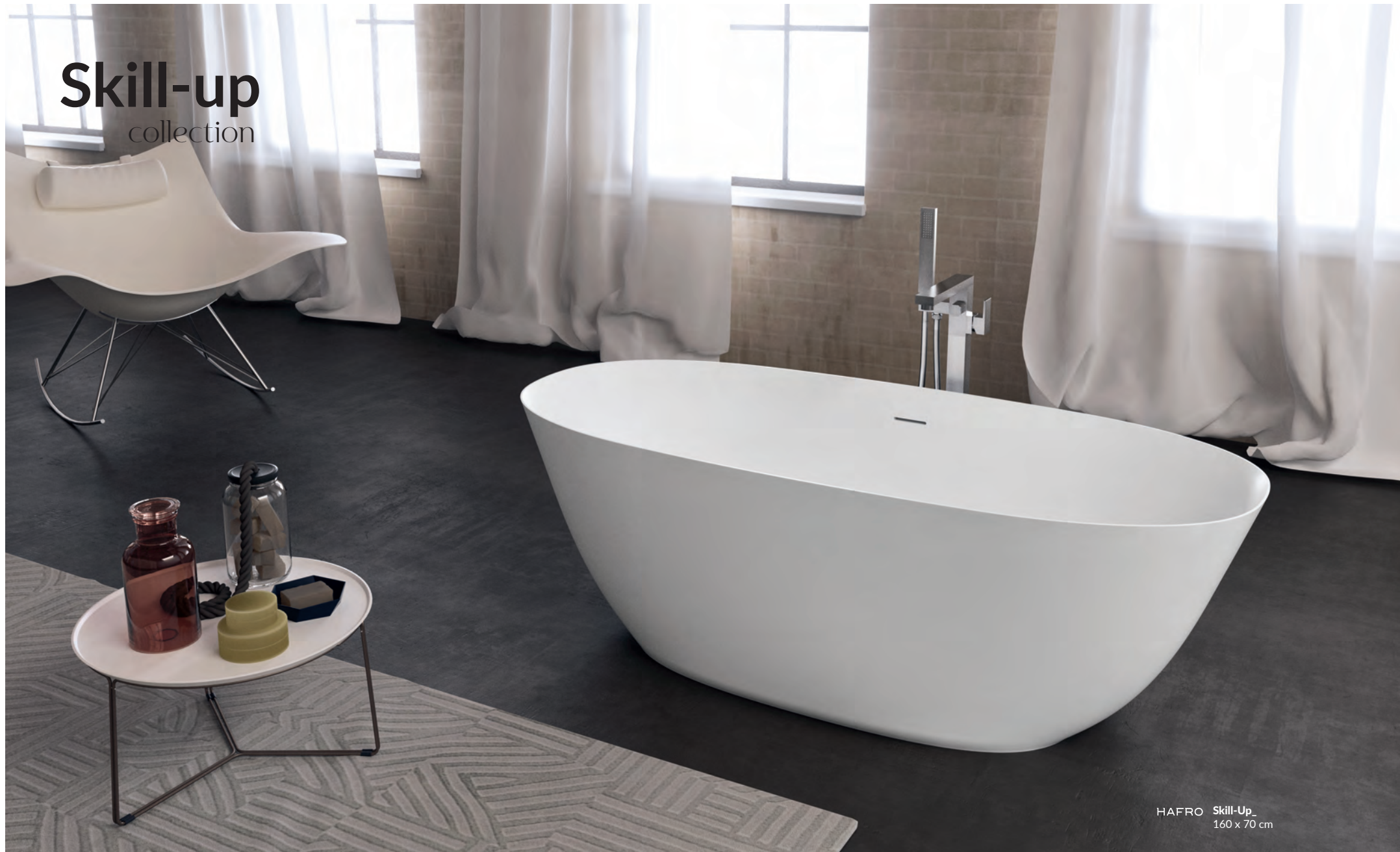
HAFRO Skill-Up_ 160 x 70 cm