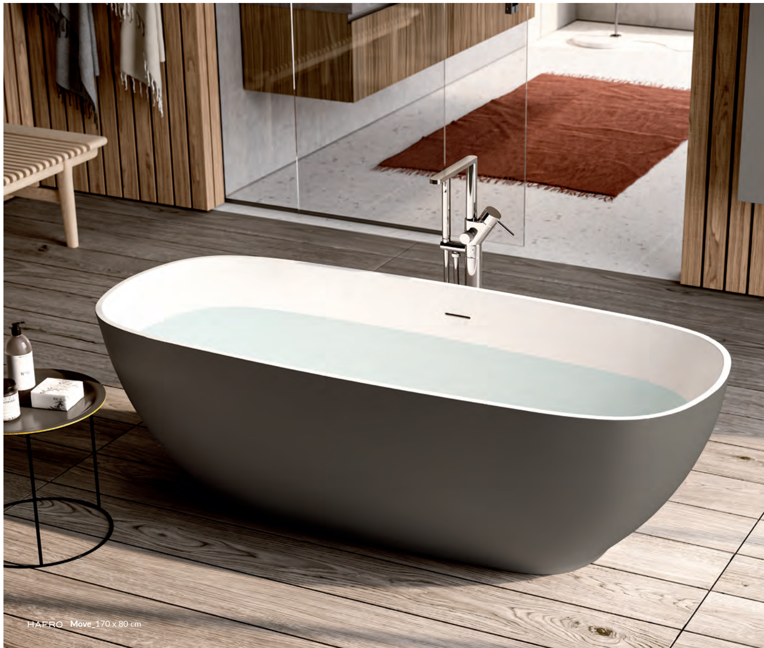
HAFRO Move_170 x 80 cm