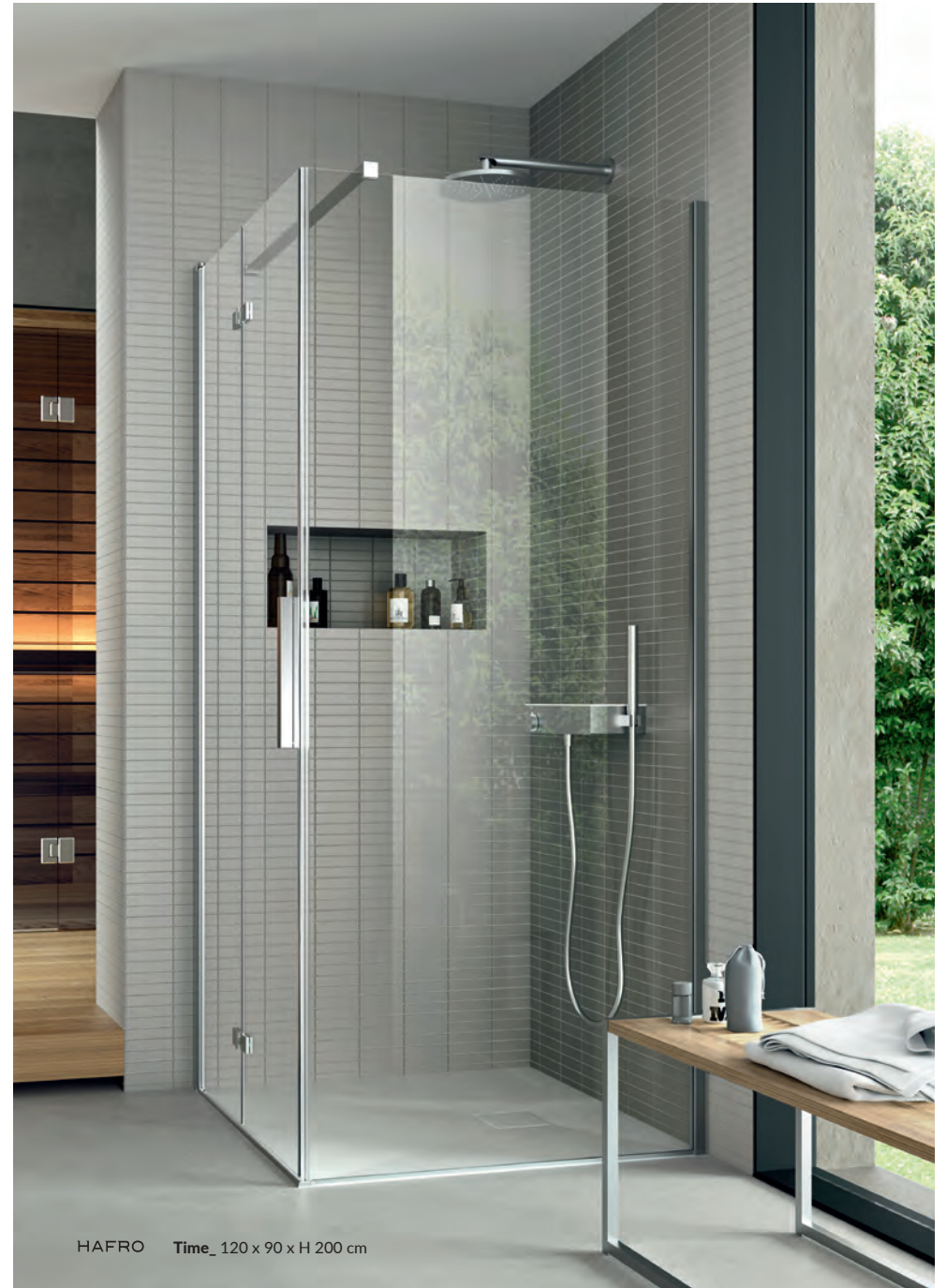
HAFRO Time_ 120 x 90 x H 200 cm