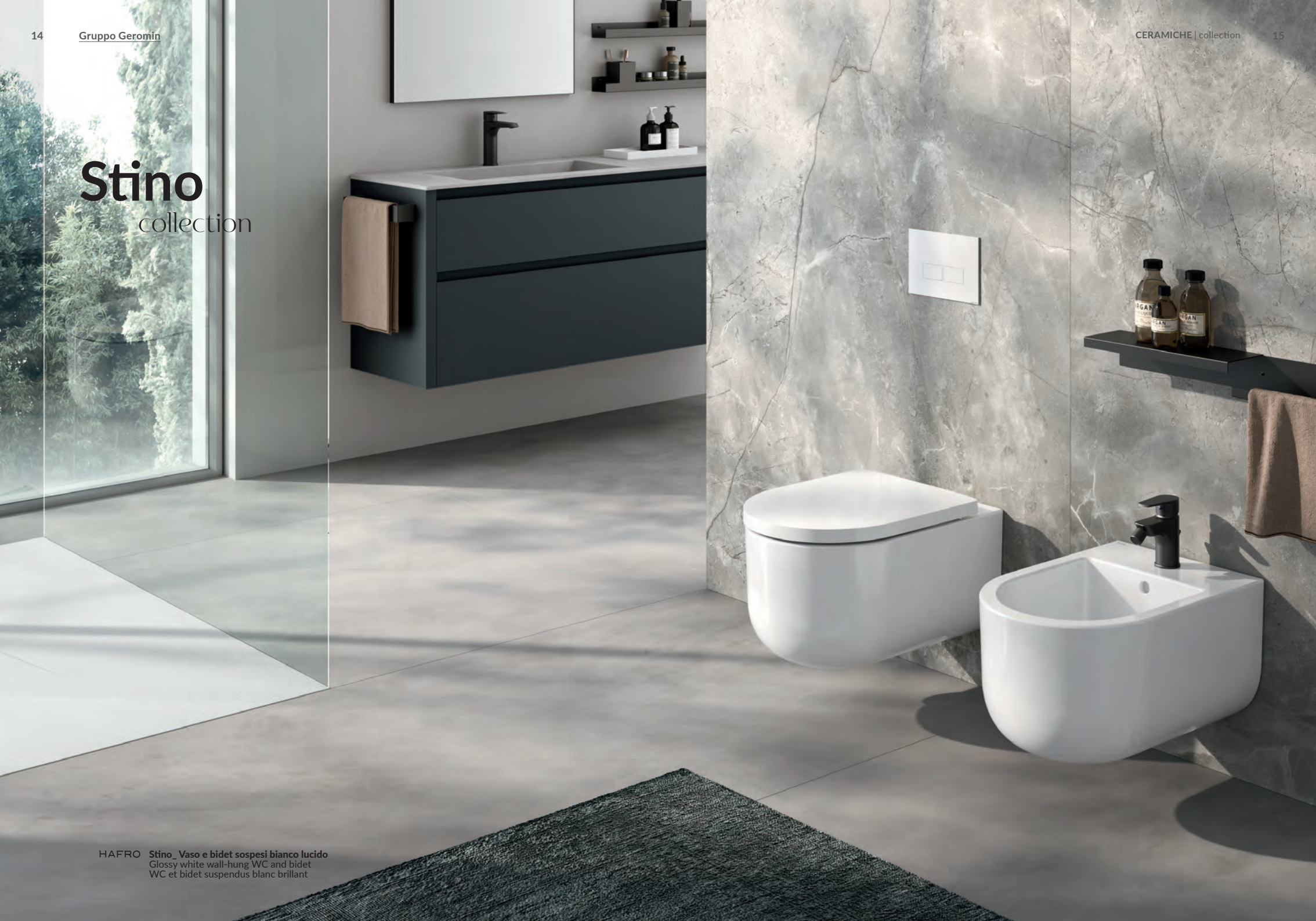
HAFRO Stino. Vaso e bidet sospesi bianco lucido Glossy white wall-hung WC and bidet WC et bidet suspendus blanc brillant