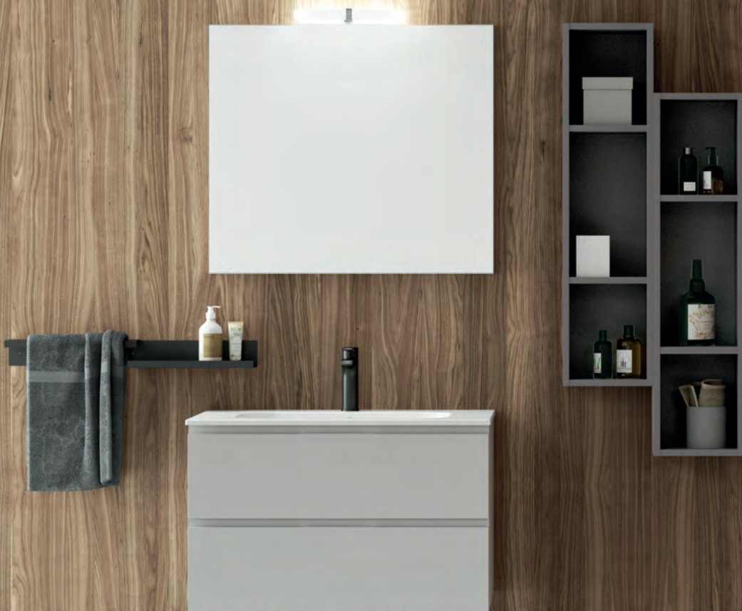
GEROMIN Comp. QUB 04 L 80 x H 50 x P 50 cm