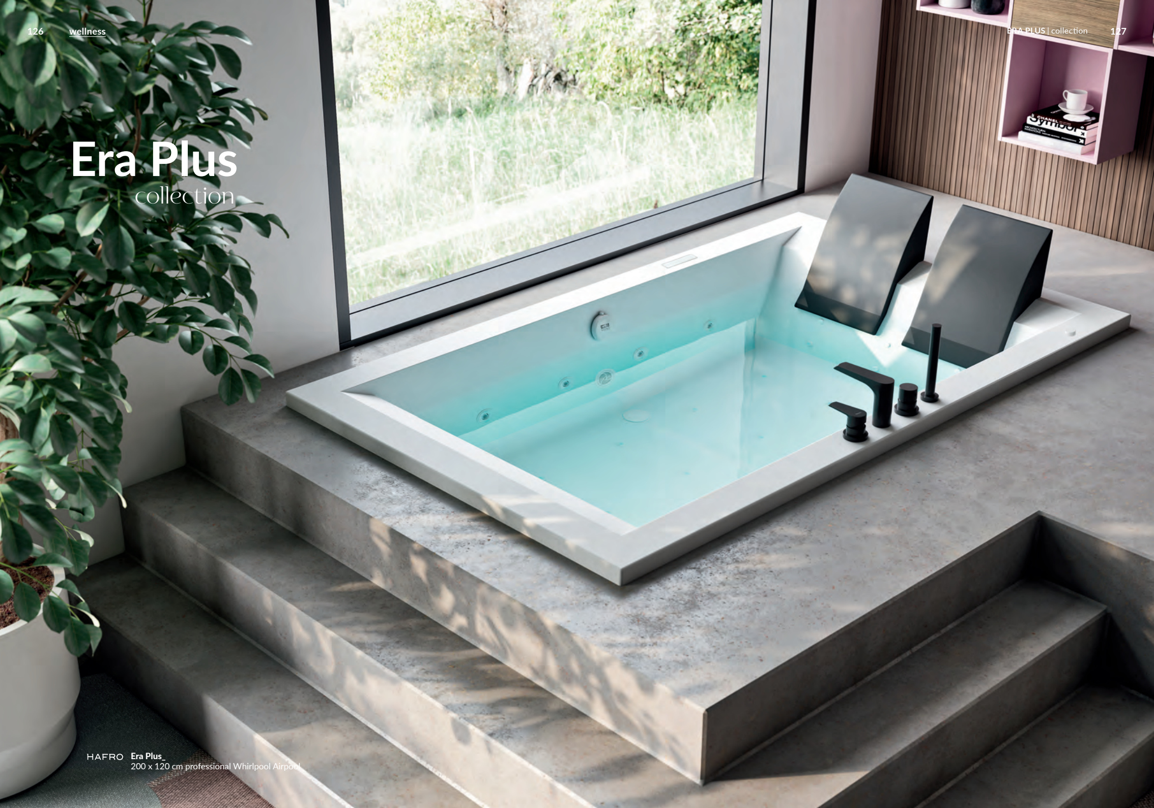
HAFRO Era Plus 200 x 120 cm professional Whirlpool Airpool