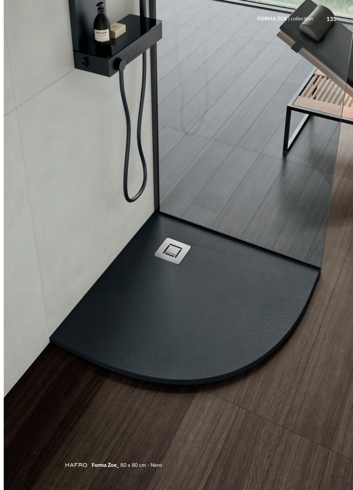
HAFRO Forma Zoe_80 x 80 cm - Nero