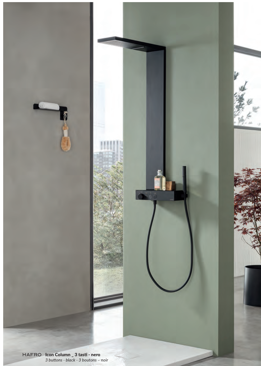
HAFRO Icon Column_3 tasti - nero 3 buttons - black - 3 boutons - noir