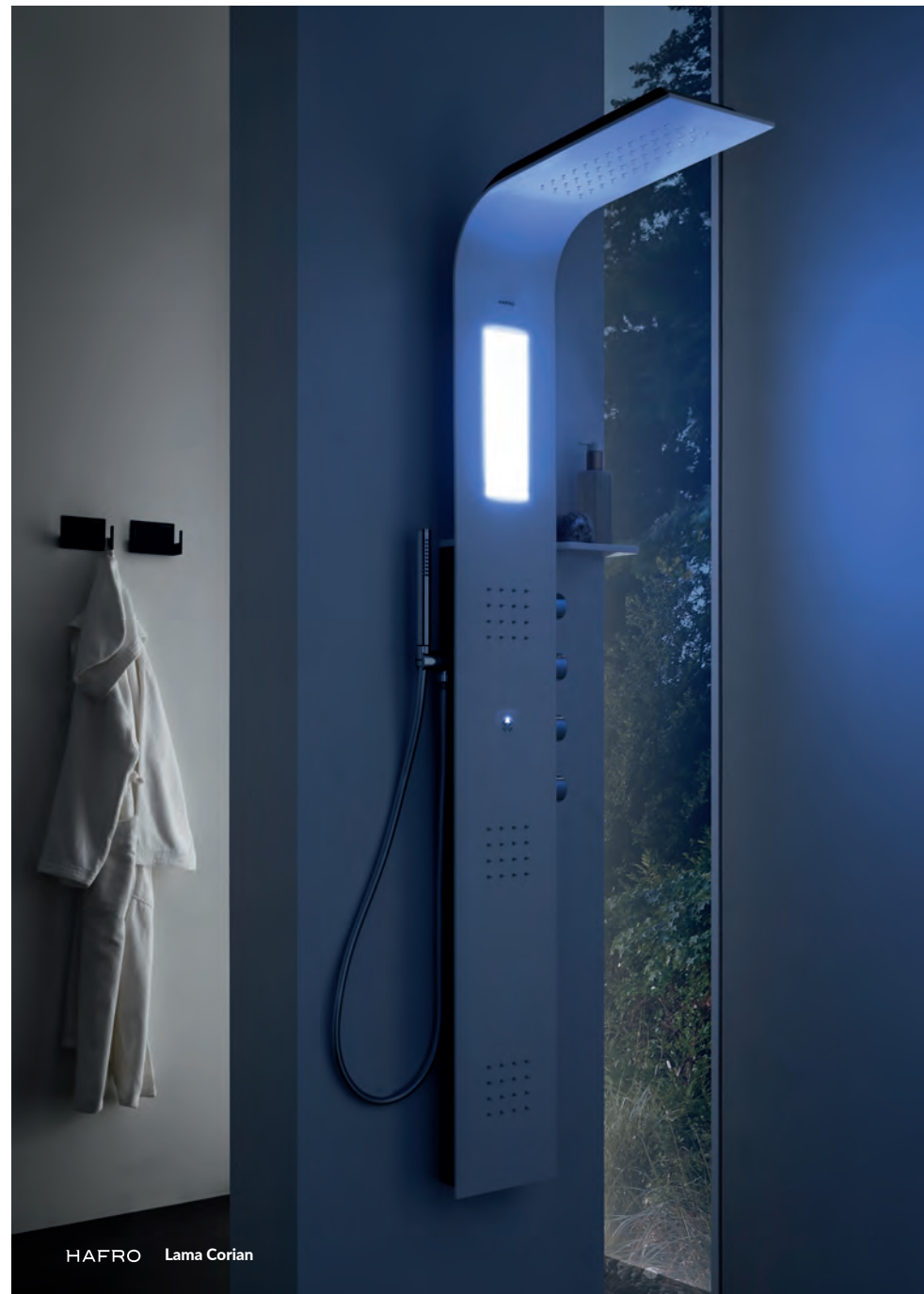
HAFRO Lama Corian