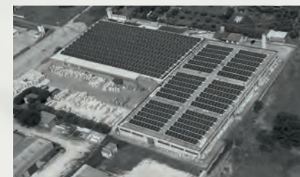
Hafro - Sanitari