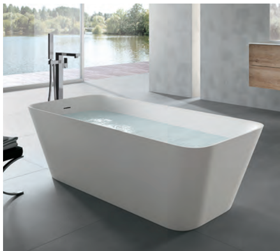
HAFRO Move_170 x 70 cm