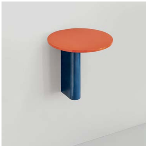
Rivington Table W45 Round