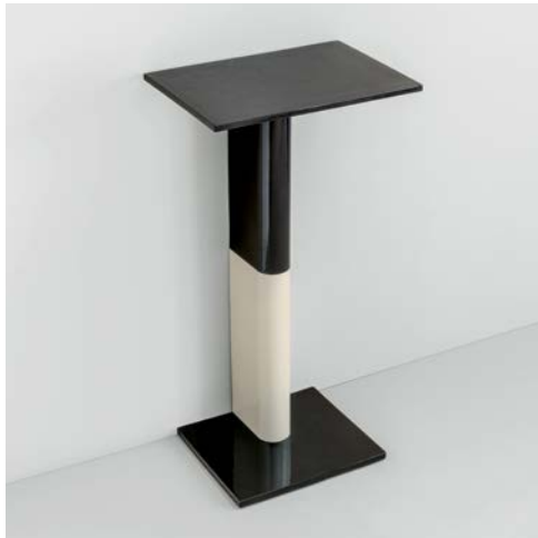
Rivington Table 90