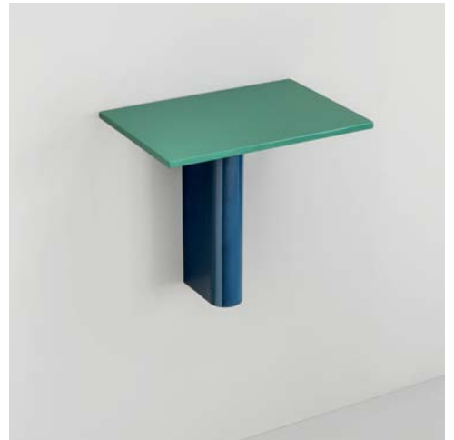
Rivington Table W45 Rectangular