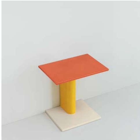
Rivington Table 50