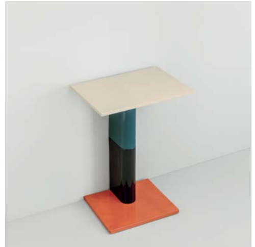
Rivington Table 65